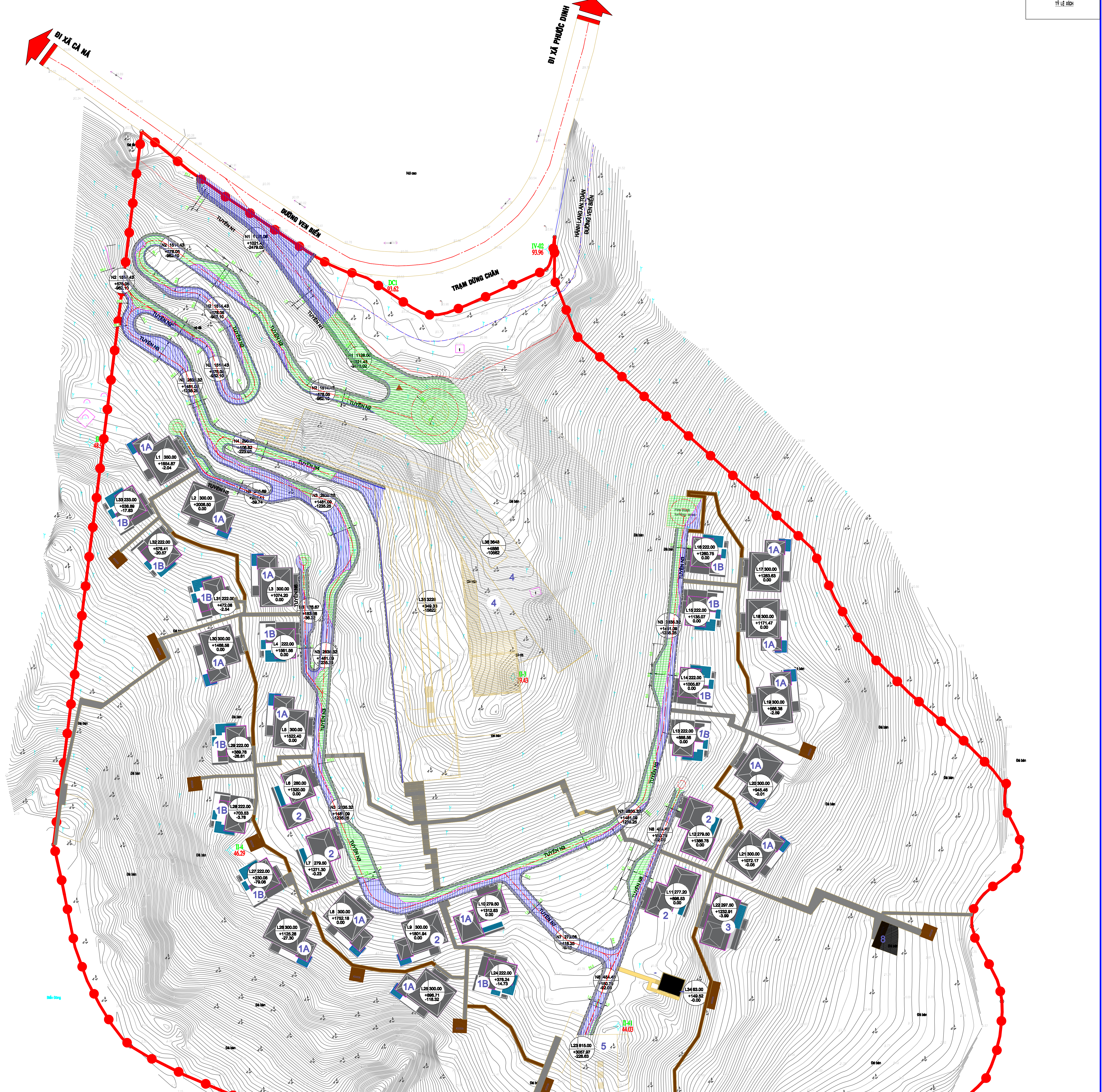
BẢNG TỔNG HỢP KHỐI LƯỢNG ĐÀO, ĐẬP